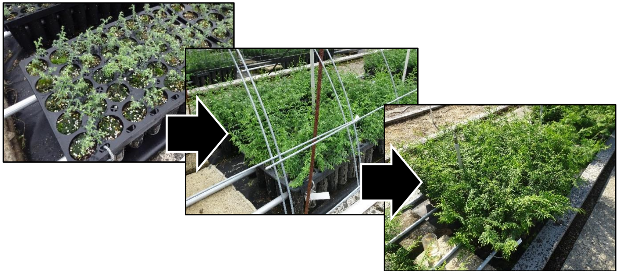
図-76 少花粉ヒノキ1年生コンテナ苗（稚苗移植）