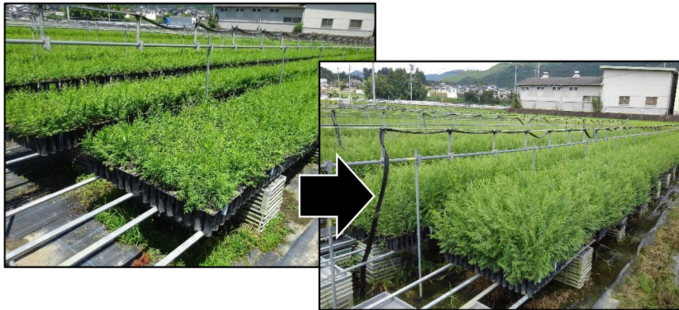
図-80 少花粉ヒノキ2年生コンテナ苗 (左側：屋外6月中旬 右側：同11月上旬)