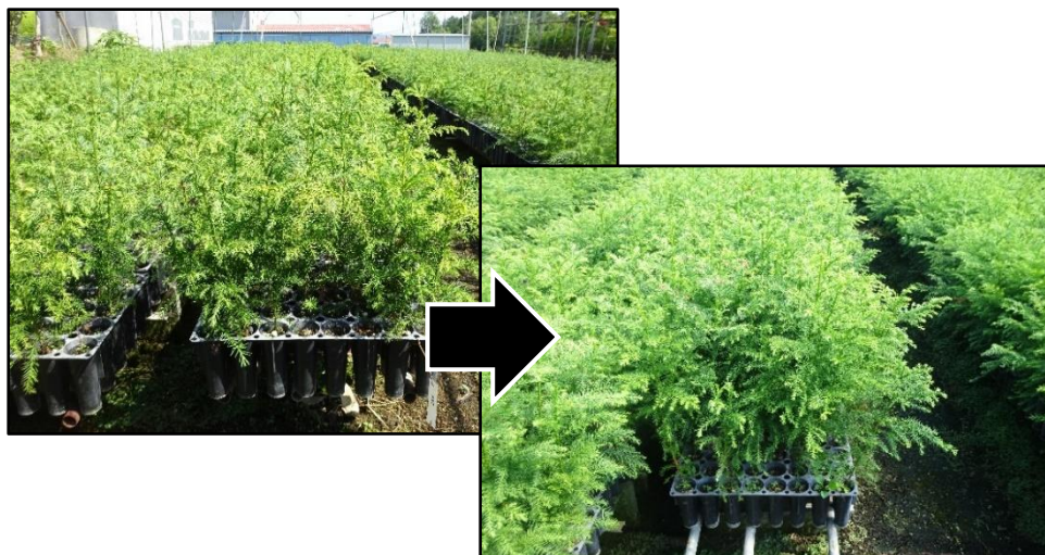
図-77 少花粉スギ2年生コンテナ苗