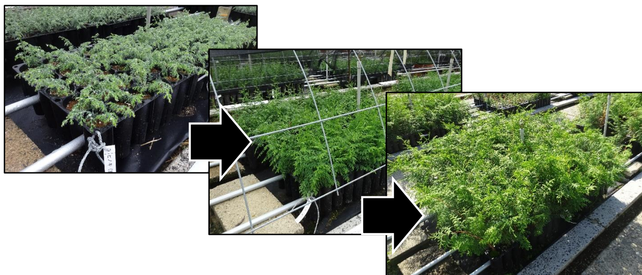
図-74 少花粉ヒノキ1年生コンテナ苗 (直接播種)