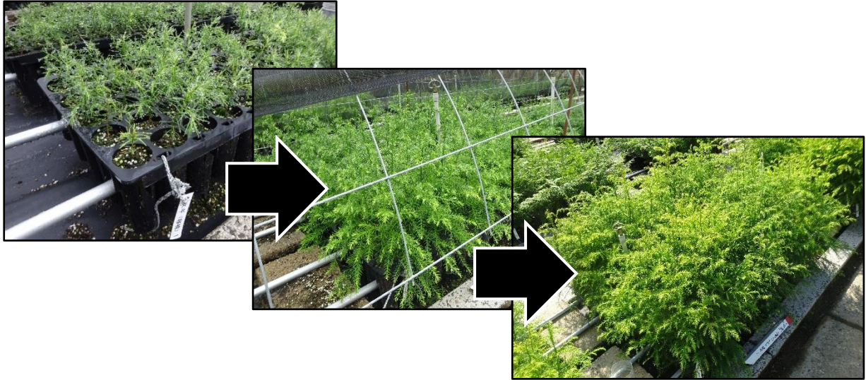
図-75 少花粉スギ1年生コンテナ苗（稚苗移植）