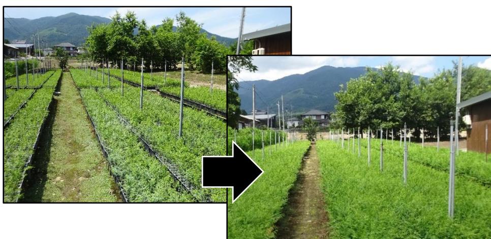
図-78 少花粉ヒノキ2年生コンテナ苗