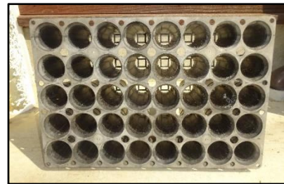
図－1 内面リブ方式（縦 30cm×横 40cm 150ml キャビティ 40 個連結）