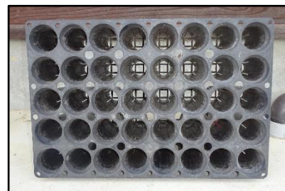
図－3 内面リブ方式+サイドスリット方式 （縦 30cm×横 40cm 150ml キャビティ 40 個連結）