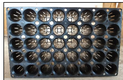
図－2 サイドスリット方式（縦 30cm×横 40cm 150ml キャビティ 40 個連結）