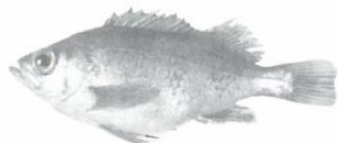
メバル (ウキソ) (12cm以下)