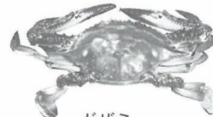
ガザミ (全甲幅15cm以下)