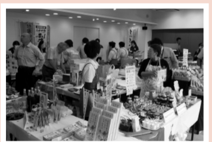
商工会連合会「とっとりおかやま」物産展