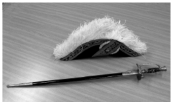
中洲着用帽子とサーベル

明治五年(一八七二年)四十三歳の時、中洲は新政府の命を受け上京、司法省へ出仕、大審院の判事・検事を務めた。明治維新後の西洋思想一辺倒に傾きはじめて世の中を危惧した