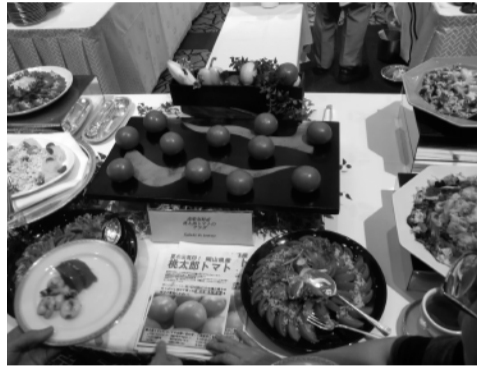
桃太郎トマト(高粱産)を使った料理