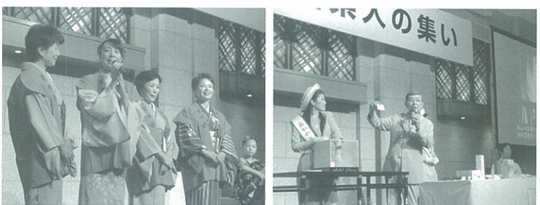
美作三湯華の会の皆さん