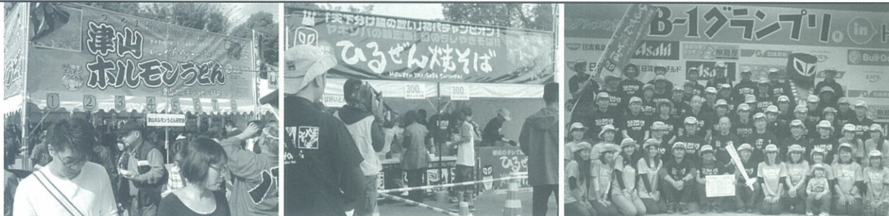
優勝した「ひるぜん焼そば好いとん会」

十一月十二日、十三日の二日間、兵庫県姫路市で開催された「第六回B級ご当地グルメの祭典! B-1グランプリin姫路」で「ひるぜん焼そば好いとん会」が第一位となるB級ご当地グルメの祭典! B-1グランプリin姫路、「津山ホルモンどん研究会」が第二位となるシルバークラウンプリを獲得、また、「日生力キオコまちづくりの会(備前市)」も第九位に入賞するなど、岡山県出場三団体すべてがベスト10に入賞する快挙を達成しました。