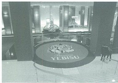
エビスビール記念館

併により誕生した大日本麦酒の初代社長に就任。合併時の国内市場占有率は約七割となり、その後、同社をスエズ運河以東最大のビール会社に発展させ、「東洋のビール王」の名を欲しいままにしました。