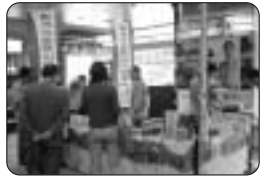
6月26日・27日に国立劇場小劇場で「備中神楽五十鈴会」と「備中神楽伝承研究会」(岡山県美星町)による備中荒神神楽の公演が行われ、備中地方の神事を再現しました。あわせて、特産品も販売されました。 *国立劇場大劇場ロビーには平櫛田中作(井原市出身)の六代目菊五郎「鏡獅子」が飾られています。