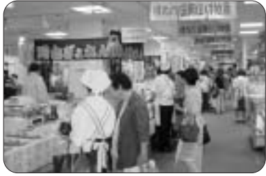
6月2日(水)～8日(火)まで、松屋浅草店では初めての「岡山の観光と物産展」が開催されました。岡山県を代表する食品と民芸品を一堂に集め、実演販売・即売を行いました。