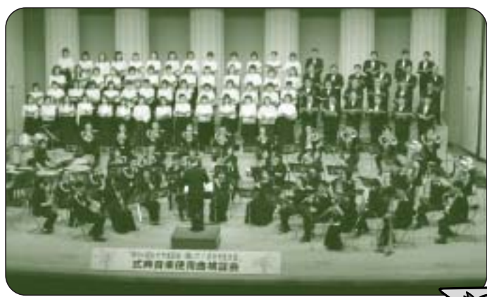
「式典音楽使用曲検証会」

来年の国体開会式では、吹奏楽隊・合唱隊、約六百名による素晴らしい祝祭の調べが、桃太郎スタジアムに響きわたることでしょう。