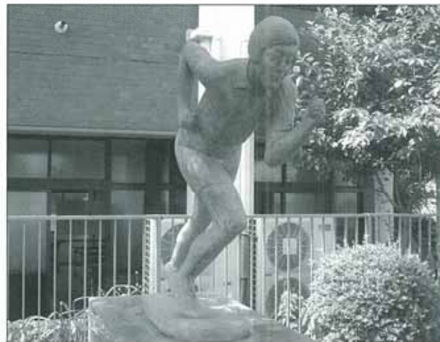
■日本女子体育大学構内の人見絹枝像 (正面からの画)

数々の女性アスリートを輩出する日本女子体育大学の構内、鳥山陸上競技場のすぐ側に、岡山が生んだ日本女性初のオリンピックメダリスト、人見絹枝の銅像がある。没後七十年に当たる平成十三年八月に、同大学陸上競技部OG会により、建立されたものである。