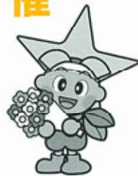
第26回全国都市緑化おかやまフェア イメージキャラクター ももっち

全国都市緑化フェアは、国土交通省の提唱により、昭和五十八年から毎年開催されている花と緑の祭典です。来年三月二十日（金）から五月二十四日（日）までの六六日間、岡山市西大寺地区をメイン会場、岡山城・岡山後楽園をサブ会場として開催します。（主催：岡山県・岡山市・（財）都市緑化基金） フェアの開催は、緑豊かなまちづくりを体験から実践へと広げるとともに、未来を担う子どもたちに花や緑、生命の大切さを伝え、さらには、歴史文化あふれる岡山の魅力を全国へ情報発信する絶好の機会です。 現在、メイン会場となる岡山市西大寺地区では、公園の整備を着々と進めており、会場内の花壇や庭園の整備を行っています。 今後、生け花やハンギングバスケット等の出展募集やボランティアの募集などを行い、県民、市民との協働によるフェア開催に向け、着実に準備を進めています。 また、二人のキャンパインスタッフが、イメージキャラクターの「ももっち」とともに、岡山市内の各種イベントで、フェアのPRや園児と一緒に花の植え付けを行うなど、積極的に広報活動を展開しています。