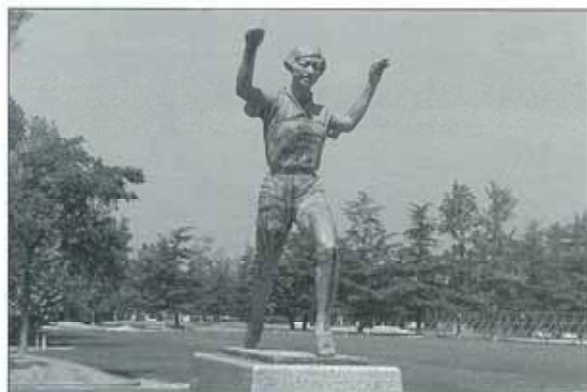
■桃太郎スタジアム前の人見絹枝像