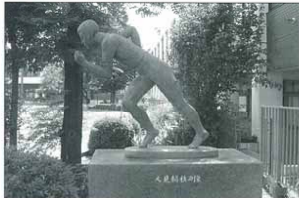
■日本女子体育大学構内の人見絹枝像 (右横からの画)

時は流れ、平成四年、バルセロナオリンピック女子マラソンにおいて、岡山出身の有森裕子選手が銀メダルを獲得。これが日本女子陸上界では人見以来のメダル獲得となった。有森選手は続くアトランタ五輪でも銅メダル、そしてシドニー五輪では山口衛里、アテネ五輪では坂本直子と、天満屋女子陸上チームの選手が連続入賞し、今年の北京五輪には同チームから中村友梨香選手が出場と、人見の系譜を継ぐランナーたちが続々と岡山から生まれている。こうした女性ランナー達の躍進の舞台となっているのが、岡山市で毎年十二月に開催される、山陽女子ロードレース大会であり、この大会十キロの部の優勝者には、彼女をかたどった人見絹枝杯が優勝杯として授与されている。発着点となる岡山市津島の桃太郎スタジアム前にもまた、彼女の銅像をみる事ができる。