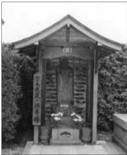
宮本武蔵の供養塔