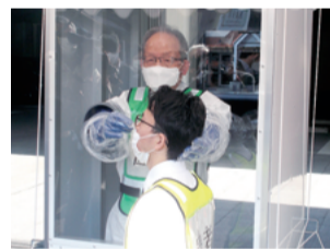
屋外検体採取センターでの検体採取 ※報道機関向けの実演の様子