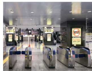
JR岡山駅新幹線コンコース

ゴールデンウィーク期間中、JR岡山駅周辺や高速道路などで来県者への外出自粛などを呼び掛け、感染拡大防止に向けた注意喚起を行いました。