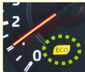
エコドライブランプの例

①エコドライブランプ * を点灯するように運転しましょう。アクセルをふんわり踏んで運転することになり、燃費が良くなります。