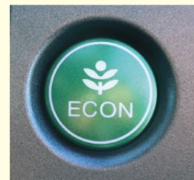
エコドライブスイッチの例

②エコドライブスイッチ * をONにしましょう。車の制御が変わって、ゆっくり加速しやすくなり、燃費が良くなります。