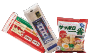
乾麺・即席麺・カップ麺