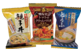
フリーズドライソース類