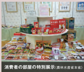
消費者の部屋の特別展示(農林水産省本省)

農林水産省では、食料安全保障の観点から、家庭備蓄の普及に向けて、省内外での展示や防災イベントへの参画、各種ガイド、リーフレット、動画の作成・普及、政府広報の活用等を積極的に行っています。