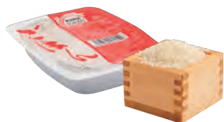
精米・無洗米・パックご飯等