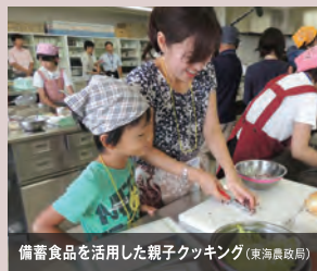
備蓄食品を活用した親子クッキング(東海農政局)