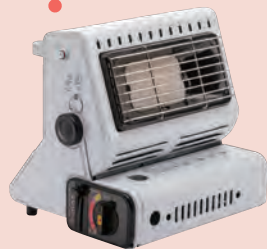
カセットボンベで使用できるガストーブ ▲