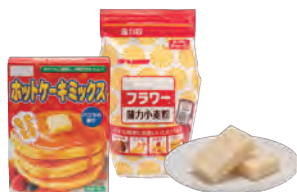
小麦粉・米粉・餅