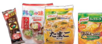
インスタントみそ汁、即席スープ等