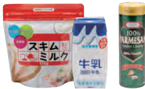
ロングライフ牛乳・粉チーズ・スキムミルク