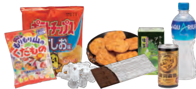
各種菓子・嗜好品