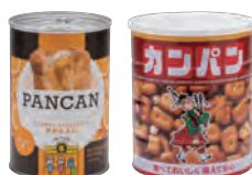
缶詰パン・乾パン