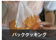
バッククッキング

断水時には、まな板もきちんと洗えない状態となりますので、まな板を使わず、キッチンペーパーを使って空中で食べ物をカットし調理する方法です。