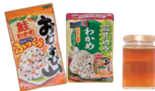
ふりかけ・ジャム・はちみつ等