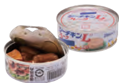
肉・魚・豆などの缶詰