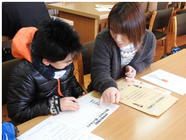
【新庄中学校入学説明会】

保護者の声 「家庭学習はなぜ必要なのかな？ そうそう、それも大切だよね・・・。」