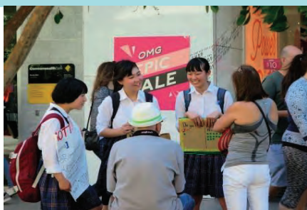
オーストラリア・アデレードでの街頭聞き取り調査