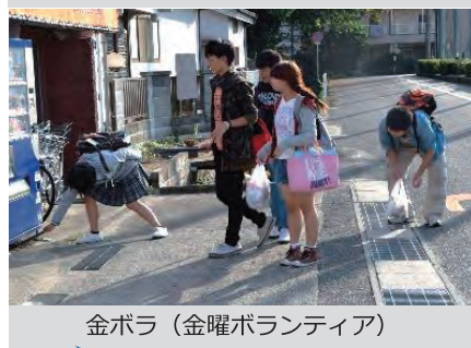
金ボラ（金曜ボランティア）