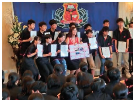
シャフストン語学学校修了式

岡山大安寺中等教育学校では、前期課程の最後3年生の3月に、3年生全員がオーストラリアでの約2週間、一人一家族でのホームステイを行い、現地学生やホストファミリーとの交流を通じて、異文化理解を深めています。海外研修や行動力・実践力・課題解決能力などを備えた「たくましい人間力」を育む取組などの成果を、4年生の6月に発表しています。このような取組により4年生は、主体的に行動することの大切さや、様々な人や物事に幅広く目を向ける視野の広さを身につけています。