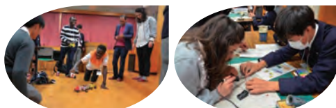
留学生との「ものづくり教室」