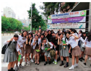
韓国 (桂園藝術高校)

岡山城東高校で、グローバルリーダーを育てるオンリーワンの教育を受けてみませんか？