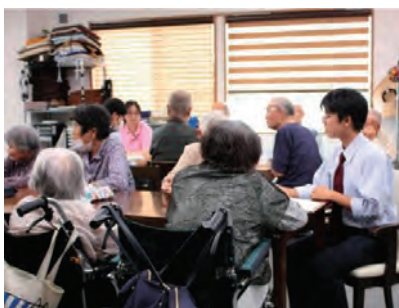
デイサービスセンターで交流や職員の方へのインタビュー