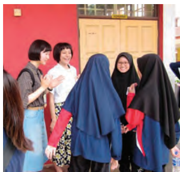
マレーシア (アエヒタム高校)

岡山城東高校では、グローバルリーダーを育てるために、様々な国際交流プログラムを展開しています。希望すればすべての生徒が1年次、2年次で海外体験の研修に参加することができます。