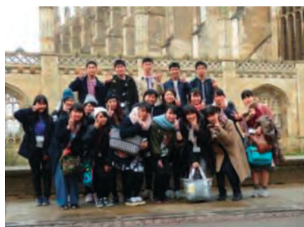
イギリスサイエンスカレッジ