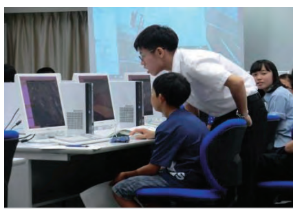
わくわくフリー塾で小学生対象にGISの指導