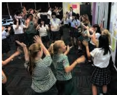
お別れパーティー