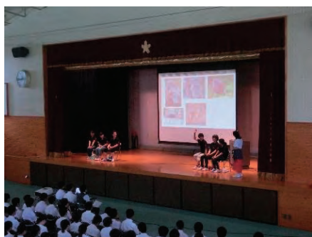
羽ばたけ大安寺生ステージ発表