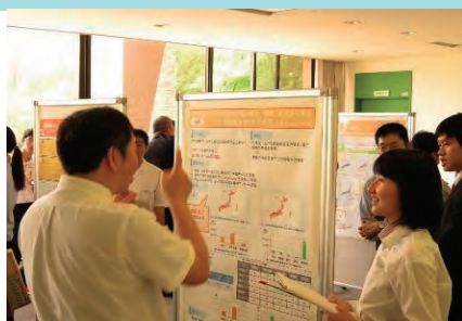
地域地理科学会におけるポスターセッション

岡山操山高校では、課題研究「未来航路」で、2年生はグループで「貧困と飢餓」、「紛争と戦争」、「健康と疾病」、「教育」、「貿易と開発」、「持続可能な開発と環境問題」などのテーマ別の研究を行い、3年生は進路希望の学部学科の学問領域を意識し、より学術的に客観的データの収集・分析・表現、内容の論理的展開に重点を置いて取り組んでいます。そのほか、オーストラリアでの課題研究調査、課題研究で身に付けた技術でボランティアなど多様な活動をしています。