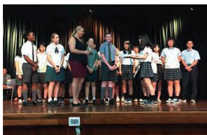
現地高校生との交流会

西大寺高校で、コミュニケーション能力の向上を図り、異文化理解を深めてみませんか？