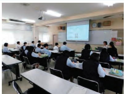
地域包括支援センターの方の講話