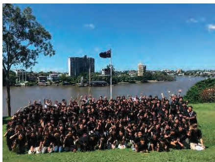
ブリスベンで全員集合