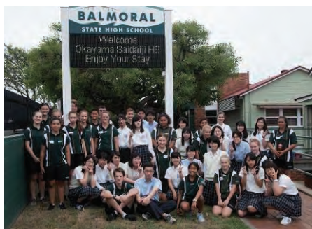
現地高校生との記念撮影

西大寺高校では、コミュニケーション能力・語学力の育成、異文化理解の取組を行っています。特に1年次には、「コミュニケーション能力育成プログラム」を実施しており、その成果を計る取組の一つとして、希望者を対象として、3月に14日間の海外短期研修を実施しています。国際情報科の生徒に加えて、商業科・普通科からの参加も多く、毎年100名を超えており、県内の県立高校の中では海外短期研修の参加者が多い学校の一つです。