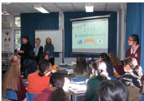
オーストラリア (サンドゲイド高校)