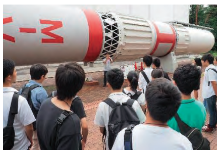
J A X A 訪問