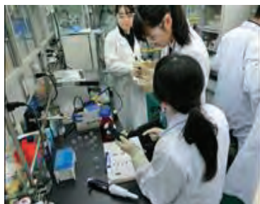
東京大学生産技術研究所