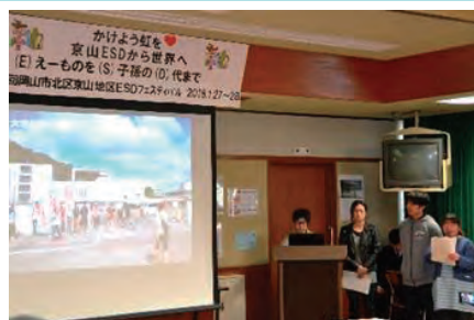
地域とつながる生徒会活動を京山ESD フェスティバルで発表

このような地域とつながる活動や多様な年代の人とつながる活動を通して得た経験は、生徒自身の未来、そして地域の未来へとつながっていきます。