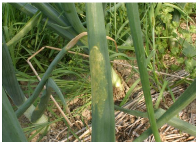
図2 二次感染株（初期病徴）