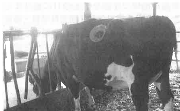
写真1 ルーメンフィステル装着牛

試験は、ルーメンフィステル装着牛（写真1）を用い、試験飼料（粗飼料）乾物4.05kgを3回に分けて給与し、濃厚飼料である圧ペンとうもろこしを朝4.5kg、夕3kg給与し、経時的に第一胃液を採取し、pHを測定しました（表1）。