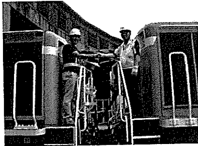
〈参考画像〉③機関車連結

⑥ 北部3線(姫新線・因美線・芸備線)の利用促進グッズ配布など鉄道の利用促進PR