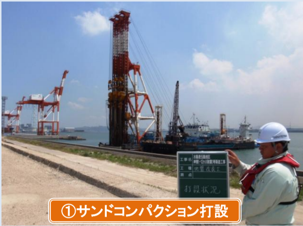
①サンドコンパクション打設