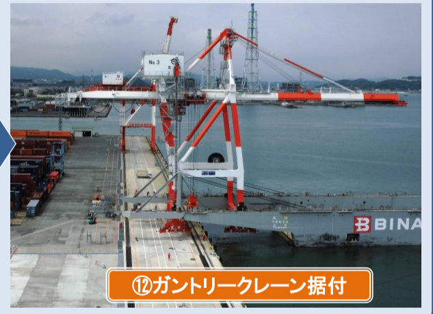
⑫ガントリークレーン据付