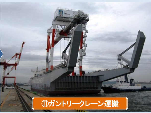
⑪ガントリークレーン運搬