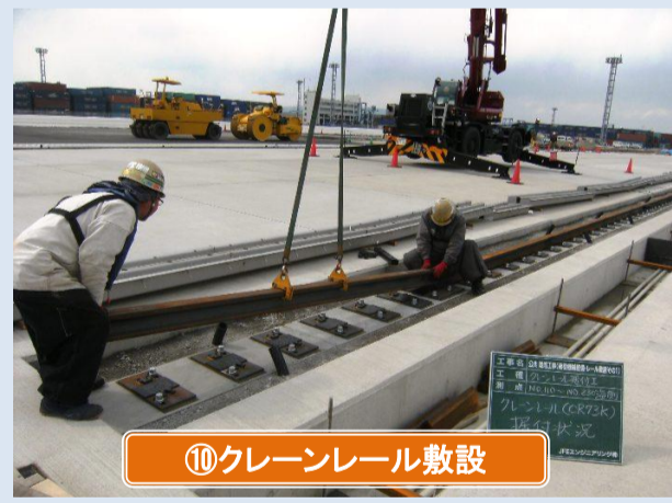
⑩クレーンレール敷設