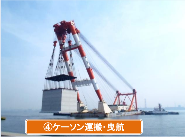
④ケーソン運搬・曳航