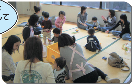
和歌山県橋本市 家庭教育支援チーム(サロン部)の取組