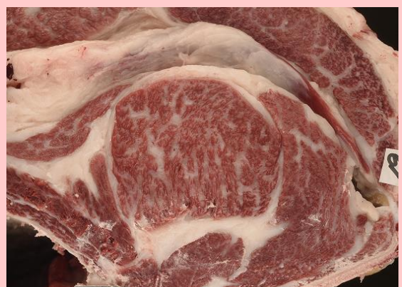
2番 547.0kg 84cm 2 BMS No.9