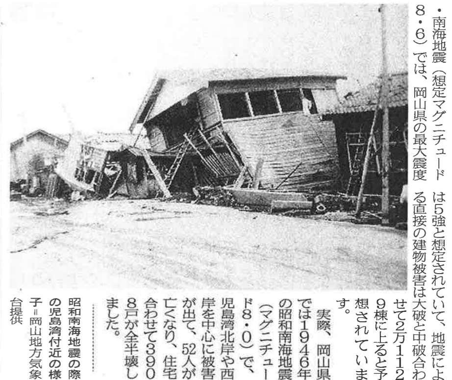
昭和南海地震の際の児島湾付近の様子。

・南海地震(想定マグニチュード8.6)では、岡山県の最大震度は5強と想定されていて、地震による直接的な建物被害は大破と中破合わせて2万1129棟以上と予想されています。