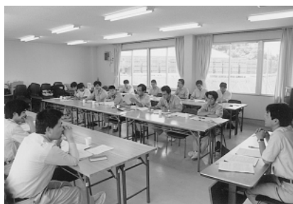
研 修 状 況

午前中は、室内で適地適木の考え方、適性な植え付け方法などの植林技術、無節材生産のための枝打ち技術のほか、間伐の方法、密度管理図の使い方など