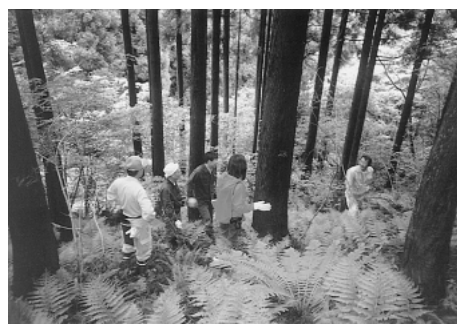
現地検討風景（西粟倉村）