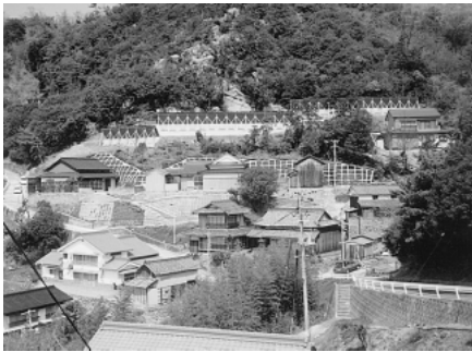
安全な生活環境を守る治山施設

風一〇号による降雨は、降り始めから降り終わるまでの四三時間に二四〇mmを超える豪雨となり、県下に多大な被害をもたらしました。