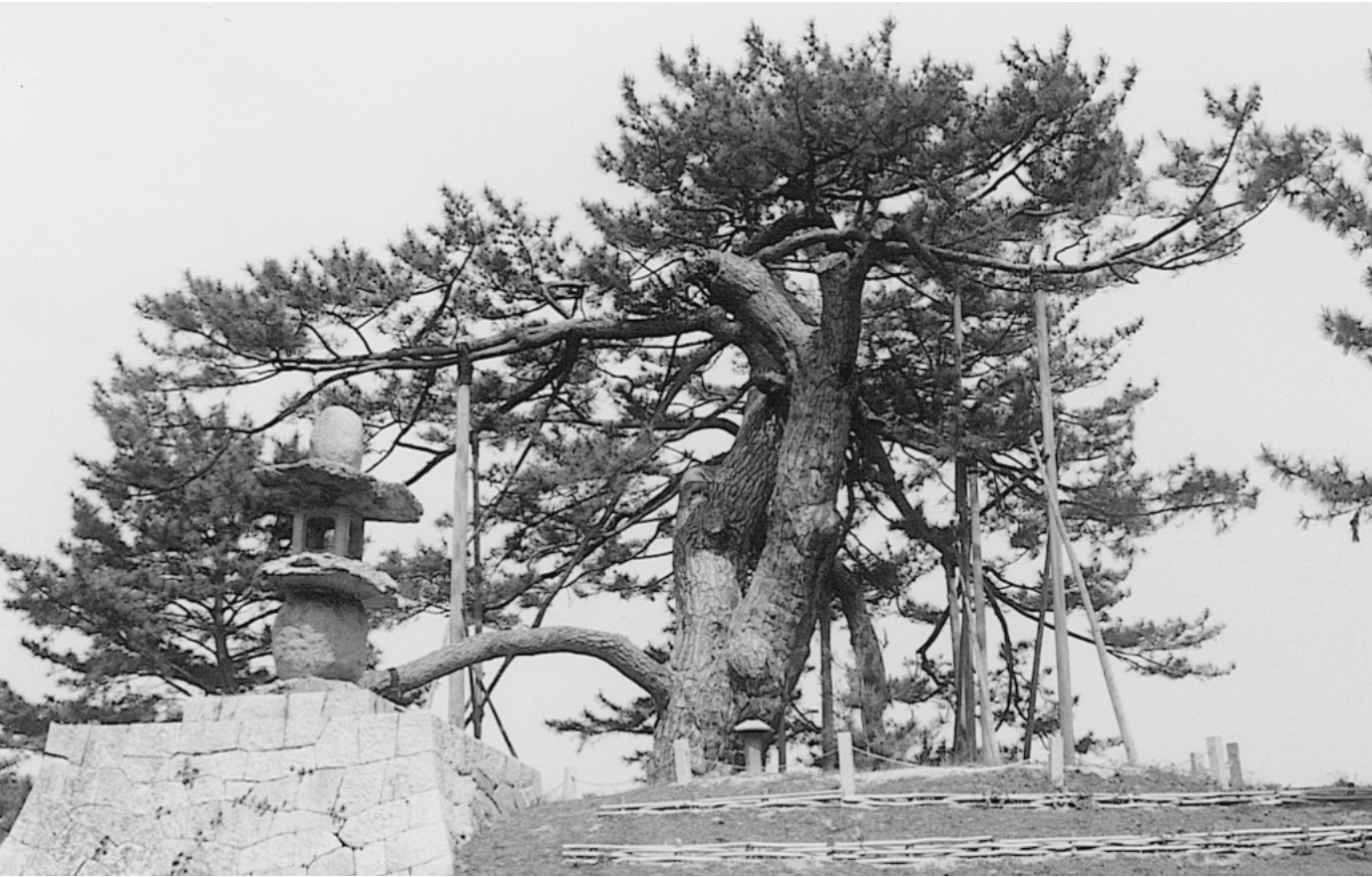
角力取山の大松(山手村)