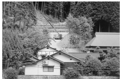
復旧の進む台風災害地