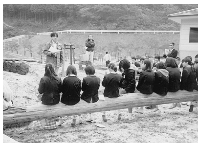
林業改良指導員による森林教室

の検討会の報告を踏まえ林業普及指導運営方針が改定されました。 その後、平成二年、林政審議会 その後、平成二年、林政審議会 開方向と国有林野事業の経営改善」が出され、この報告において、民有林・国有林を通じて、「緑と水」の源泉である多様な森林の整備、「国産材時代」を実現するための林業生産、加工・流通における条件整備を林政の基本課題とし、課題の達成手法として、林政審議会は森林の「流域管理システム」の確立が提唱されました。 その後、平成三年九月、高性能林業機械化促進基本方針が国から公表され、これにより、高性能林業機械を中心とする新しい作業システムの確立とその導入を推進していくことが急務とされました。平成五年、森林・林業及び山村を取り巻く情勢の変化に対応して、林業普及指導事業の確な運営を図るため、林業普及指導事業検討会が国において設置されました。平成七年、この検討会の報告を踏まえ、林業普及指導運営方針が制定され、多様化している林業経営の現状を踏まえ、普及指導を推進していくこととなりました。