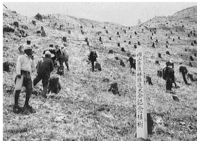
岡山県造林推進大会 (昭和47年5月)

(三) 実施方針の五年ごと見直し制の新設 五八年に「林業普及指導推進要綱」が制定され、目的を「森林所有者等に対し、林業に関する技術及び知識の普及と森林施策に関する指導を行い、林業技術の改善、林業経営の合理化、森林の整備等を促進し、もって林業の振興を図るとともに、森林の有する諸機能の高度発揮に資する。」とし、その対象者を「森林所有者その他林業を行う者又は林業に従事する者及びこれらの後継者とする。なお、必要に応じて青少年等一般市民に対しても森林・林業の啓蒙等適