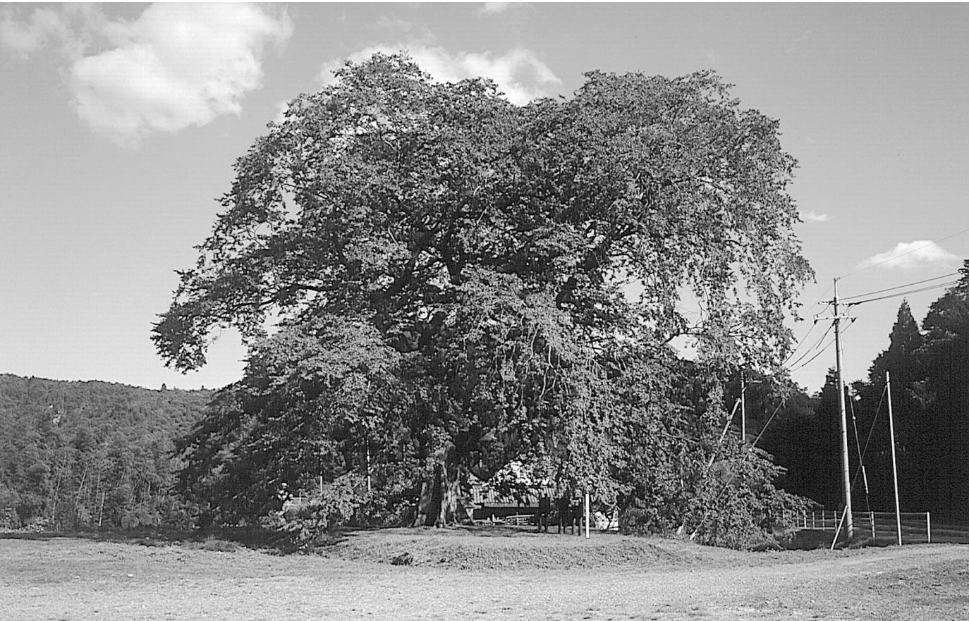
横川のムクノキ(英田町)