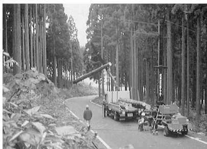
高性能林業機械(タワーヤーダー)による木材搬出(平成4年)

切な普及指導を行うものとする。」と規定されました。 この要綱に基づき、五年ごとに「林業普及指導運営方針」を定めることとなりました。本県では同年、これをもとに「林業普及指導実施方針」を策定しました。 (四) 昭和六〇年代から現在まで 六三年、林業普及指導事業検討会が国において設置され、この検討会の報告を踏まえ林業普及指導運営方針が改定されました。 その後、平成二年、林政審議会