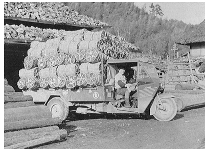
木炭を満載したオート三輪 (昭和30年代)

当する林業技術普及員と林業経営指導員の職務が統括され林業技術員と総称されることになりました。