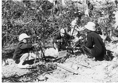
キンモクセイを植える児童・保護者 (さくらの丘)

この日は、「秋の緑の月間」期間中となるため、保全林北側の「さくらの丘」には、キンモクセイやクスノキなど緑化木を五十種、三百本植栽し、保全林内の樹木と併せ、百種類の樹木へ名鑑を付けました。