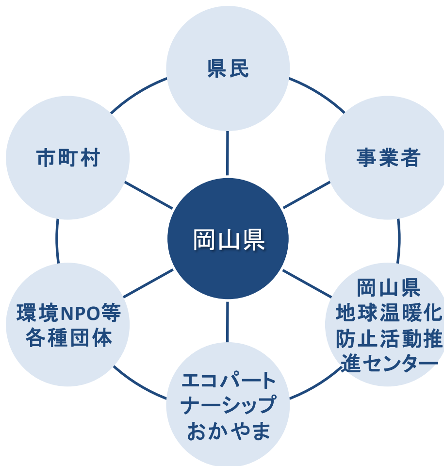
図 44 推進体制のイメージ

計画の推進にあたっては、県民団体や事業者団体、行政が協働して地球温暖化防止活動をはじめとする環境保全活動に取り組むことを目的に設立された「エコパートナーシップおかやま」や環境 NPO 等とも連携し、地球温暖化防止に向けた取組を推進します。