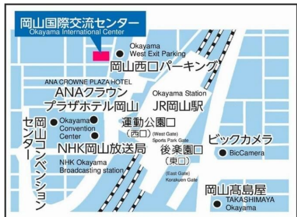
岡山市勤労者福祉センター位置図