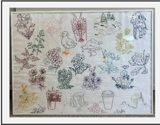
ひとつひとつ 心を込めて まさに職人技 —花手芸—

社会福祉法人弘徳学園の「デイサービスセンターすまいる」です！ 県庁アート初出展となりますが、一人一人が生み出すアートを楽しんでいただくと嬉しいです。