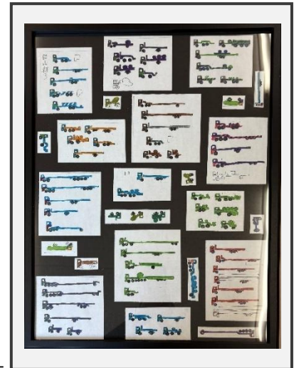
ペンを使って 色々なカタチの トラックを 描きました。