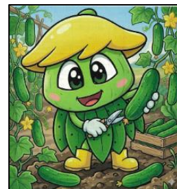
久米南キュウリ部会キャラクター 『みずきん』