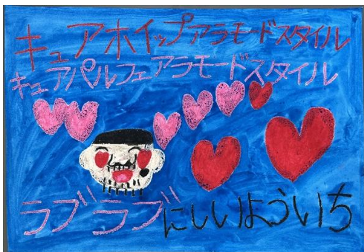
西井 陽一 「キュアホイップ アラモードスタイル」