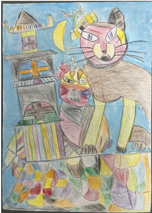
4.N・T 「城主猫とタカちゃん」