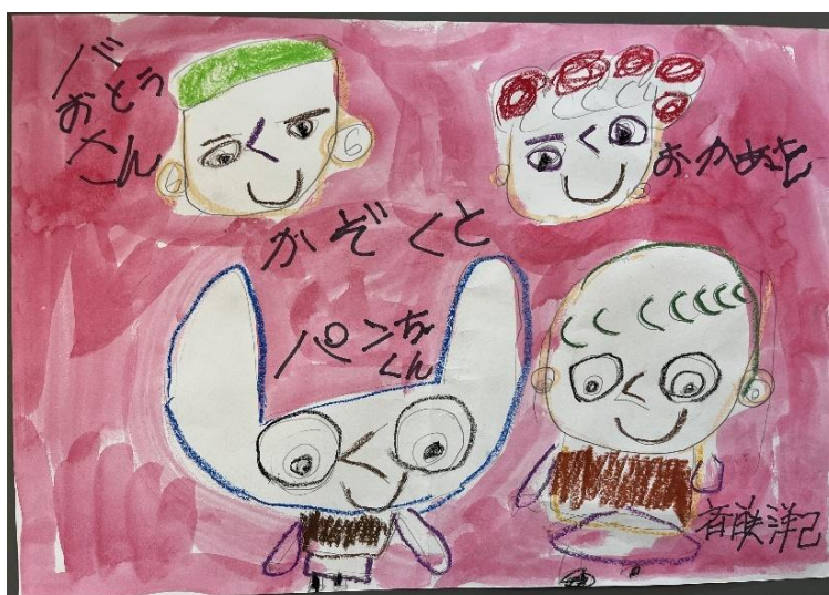
1.齋藤 洋己 「大好きな家族と猫のパンチ君」