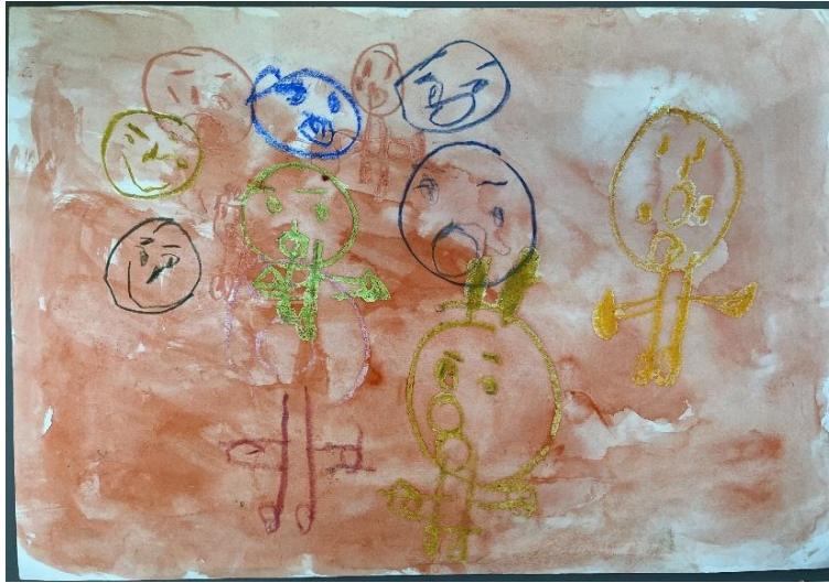
3.田中 思帆 「紅葉ドライブ」