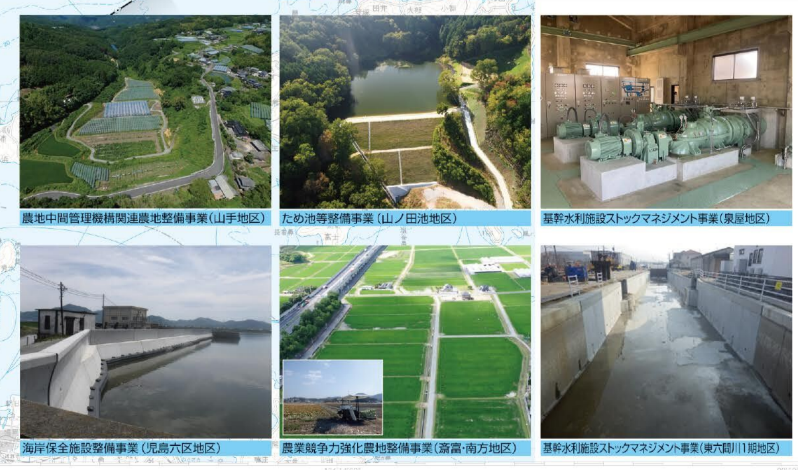
農地中間管理機構関連農地整備事業(山手地区) ため池等整備事業(山ノ田池地区) 基幹水利施設ストックマネジメント事業(泉原地区) 海岸保全施設整備事業(児島六区地区) 農業競争力強化策農地整備事業(高富・南方地区) 基幹水利施設ストックマネジメント事業(美六川1期地区)