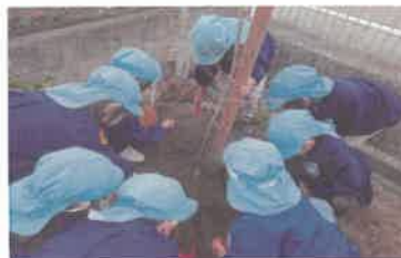
身近な公園などの緑化 (支部緑化 (総社市))