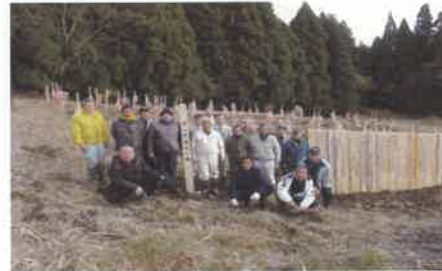
森林組合による学校の森造成 (津山市阿波)