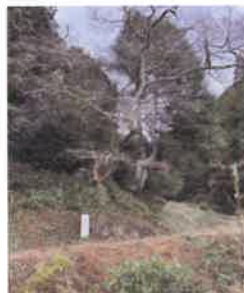
巨樹・老樹・名木の保存 (美作市馬形の豎皮樹)