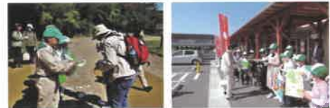
みどりの少年隊による募金活動