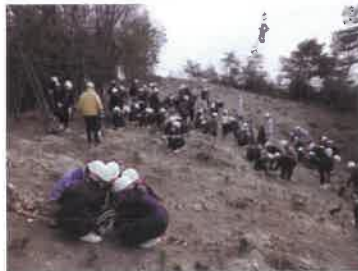
子どもたちによる植樹 (備前市立小学校)