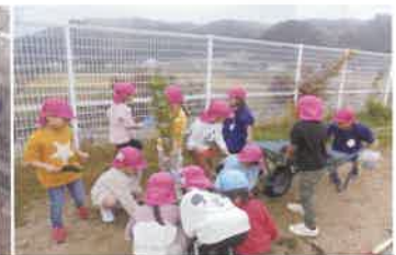
身近な公園などの緑化 (支部緑化 (美作市))