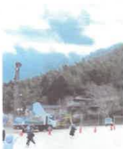
学校環境緑化 (矢掛町山田小)