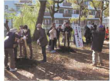
市民による公園の緑化 (倉敷市酒津公園)