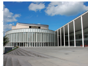
ふれあい広場 (新見文化交流館)

講座では、講師の指導のもと、受講生が主体となって、11月に2日間、アートイベントを実際におこないます。イベントをするのが初めてという方でも、チームで実施するので失敗を恐れずチャレンジできます。