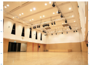
小ホール (新見文化交流館)

イベントのコンセプトづくりから企画、予算の計画・執行、招へいアーティスト選定、イベント準備・当日の運営まで、イベント開催に必要な過程をゼロからすべて経験できます!