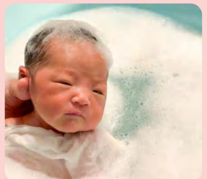
授乳や沐浴方法 パパも学べるよ!!