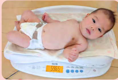
赤ちゃんのケア 発育や排泄チェック