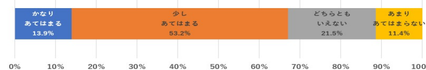
【図3】先生同士で情報共有する機会が増える