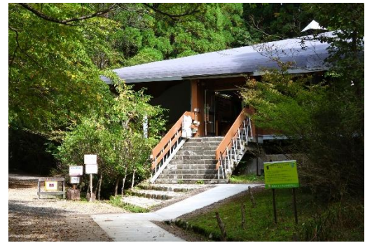
管理センター外観