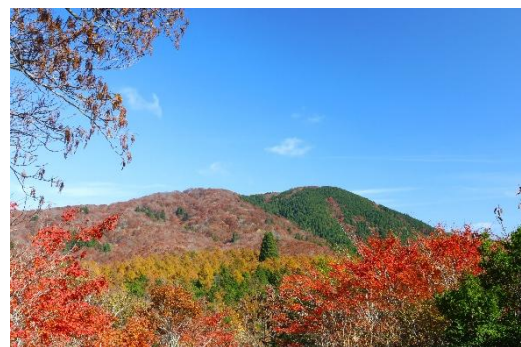
南展望台からの景色（秋）