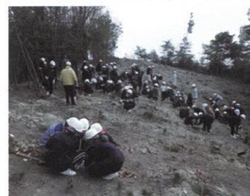
子どもたちによる植樹 (備前市立小学校)