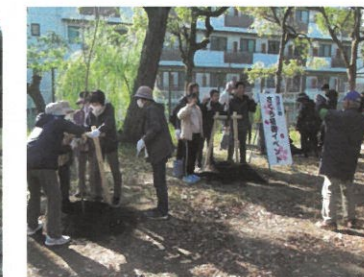
市民による公園の緑化 (倉敷市酒津公園)