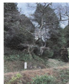
巨樹・老樹・名木の保存 (美作市馬形の豎皮坂)