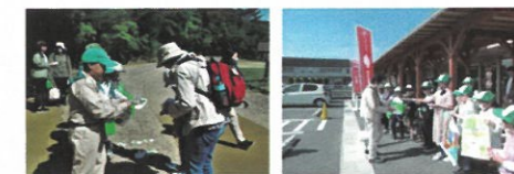
みどりの少年隊による募金活動