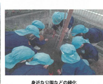
身近な公園などの緑化 (支部緑化 (総社市))