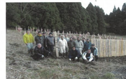
森林組合による学校の森造成 (津山市阿波)