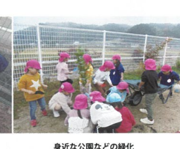
身近な公園などの緑化 (支部緑化 (美作市))

緑の募金で進めようSDGs(持続可能な開発目標) 緑の募金にご協力をお願いします