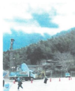
学校環境緑化 (矢掛町山田小)