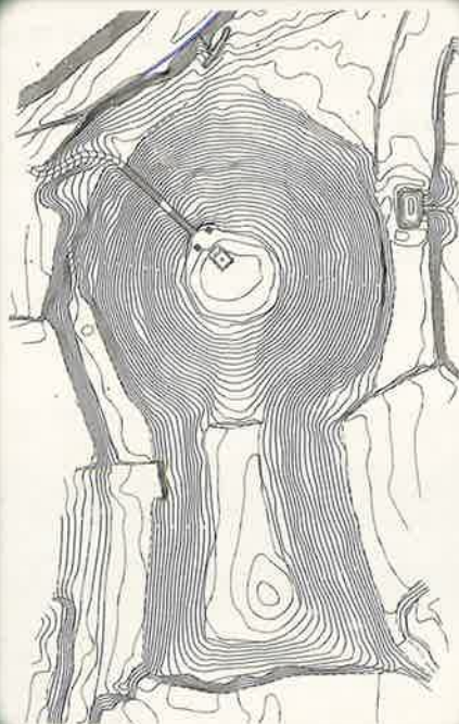
兵庫県愛宕山古墳墳丘測量図