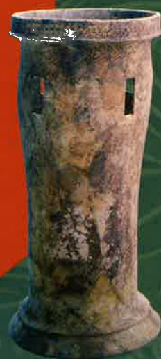
島根県塩津山1号墳出土 円筒土器

埋葬施設、埴輪など古墳の要素、さらに海外の墳丘墓にみられる 交流の様相などから、様々な地域間交流の在り方を示します。