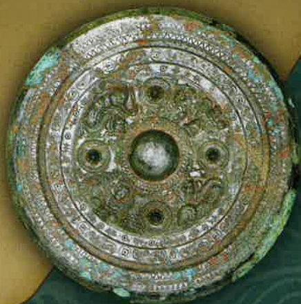
鳥取県曾段寺1号墳出土 三角縁神獣鏡 (大安寺蔵 鳥取県立博物館提供)