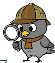
玉島商業高校探究チーム （タマタン） チームマスコット アミコ