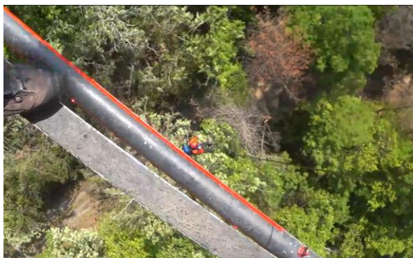
救助訓練（尾水尾池）