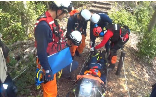
美作消防連携訓練