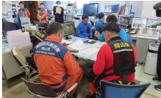
中国ブロック合同訓練