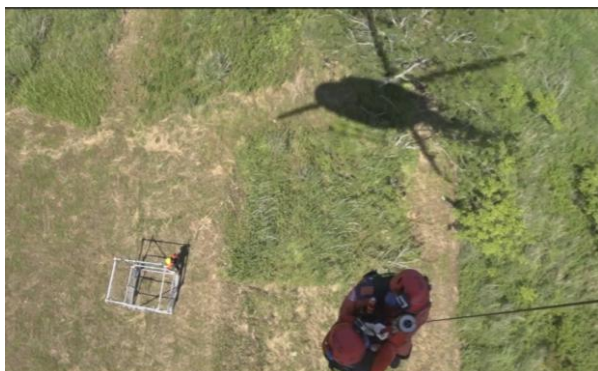
救助訓練（残土センター）