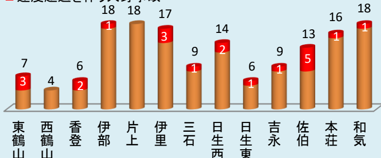
■ 速度超過を伴う人身事故

○ 国道2号、国道250号、国道374号での死亡・重傷交通事故では、速度超過が絡む事故が多数発生しています。 ○ どの路線でも、午前6時から午後6時までの間の発生が多くなっています。