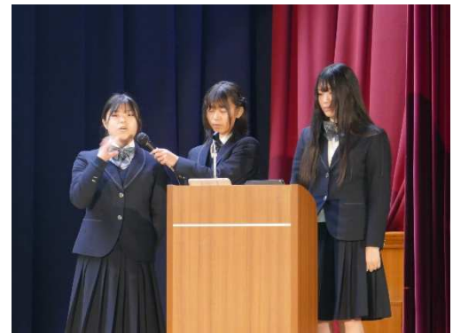
2年次生「テーマ探究」プレゼンテーションの様子(手話の可能性について)

3 参 加 者 笠岡高校1、2年次生 261名 笠岡市役所関係各課職員、団体関係者、大学関係者、保護者、中学生等