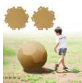
多面体ダンボールでボールを作ろう