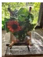
炭由来の脱臭剤でボードを作ろう