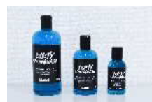
LUSHに採用された海洋プラスチックごみ再生プラ使用化粧品ボトル