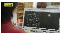
学生服を構成するパーツで生地のパズルにチャレンジしよう