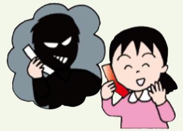
知らない人との情報交換は危険です。