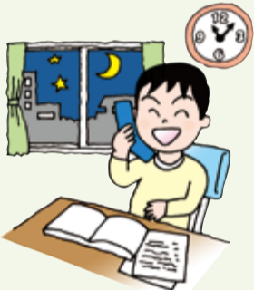
使う時間を決めましょう。