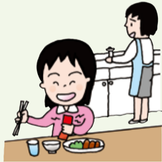
使う場所やマナーを教えましょう。