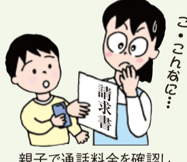
親子で通話料金を確認し合ってみませんか。