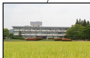
農林水産総合センター