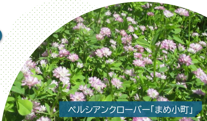
ペルシアンクローバー「まめ小町」