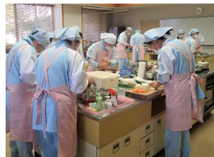
調理実習 (各グループで献立・調理)