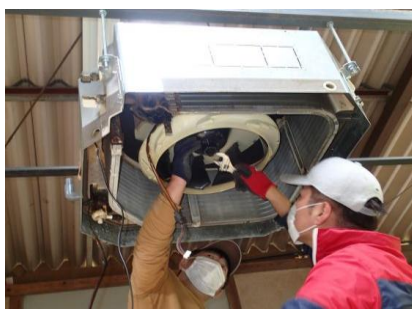
天井カセット型エアコン点検

ルームエアコン・天井カセット型エアコンの設置や修理・清掃に関する技術を幅広く学びます。