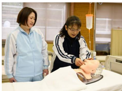
経管栄養のケア実習