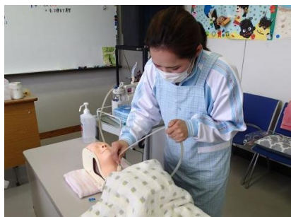
喀痰吸引のケア実習