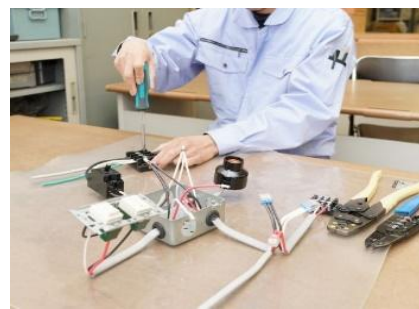
第二種電気工事士実技実習