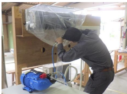
ルームエアコン洗浄実習