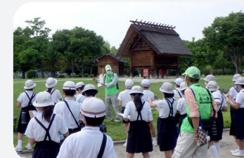
津島遺跡のガイド