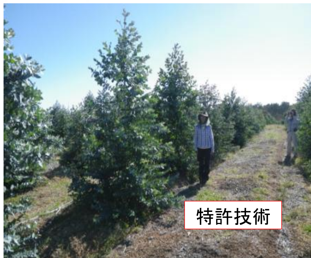
ユーカリ（西豪州試験地）

もちろん、植物の生育には、水、光、二酸化炭素のほか、体をつくるための窒素やリンなどの栄養素、そして適当な温度が必要です。「いい種子」があっても育成するための条件がいい加減では「いい苗」にはなりません。わたくしたちは、保有特許によって生産性を大幅に向上させることができます（*参考）。その特許技術に使う資材を陸域や水域からのバイオマスで製造するための技術開発を目指します。