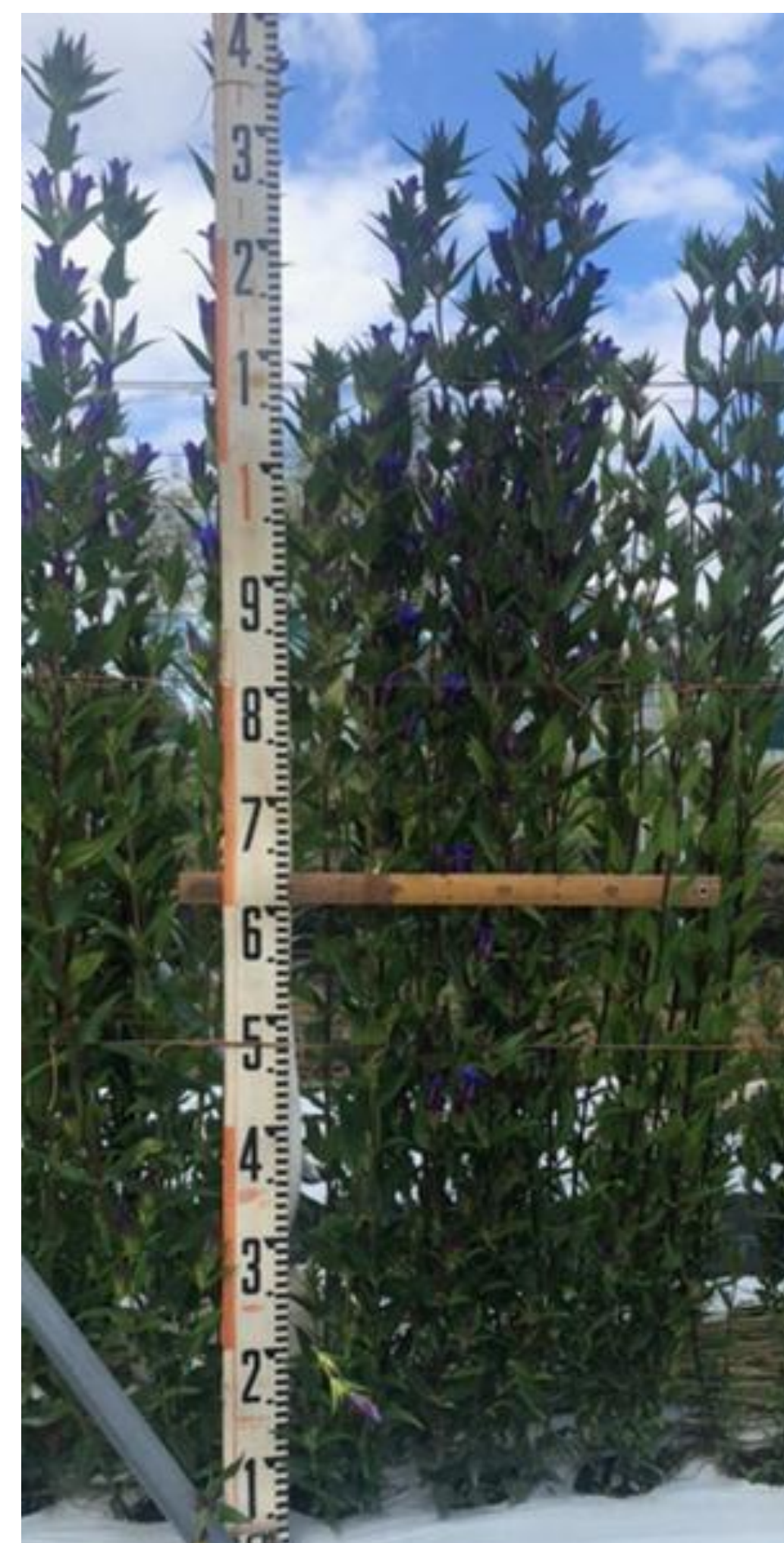
ほ場で開花する 「岡山RND6号」