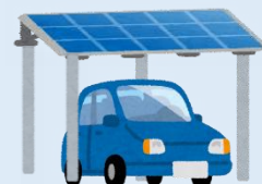
ソーラーカーポート