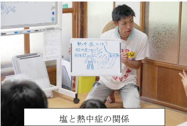
塩と熱中症の関係