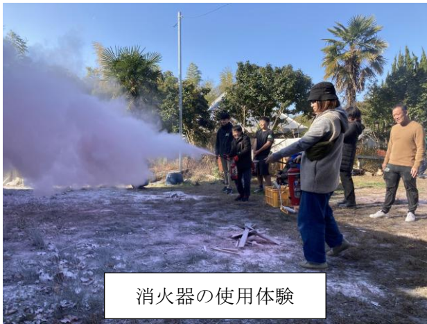
消火器の使用体験