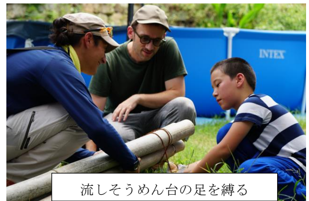
流しそうめん台の足を縛る