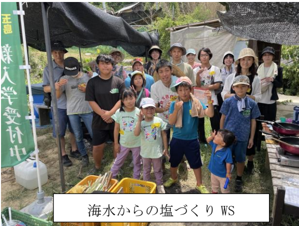
海水からの塩づくり WS