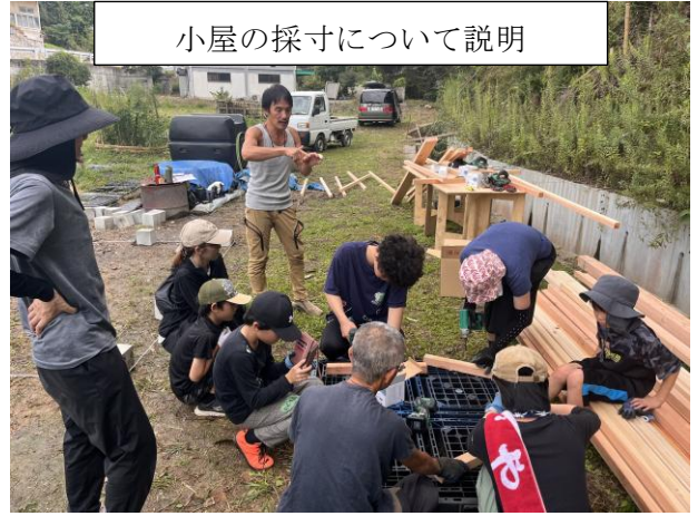
小屋の採寸について説明