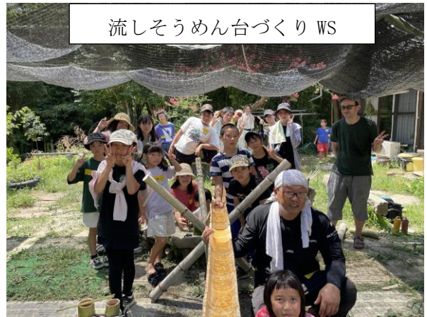
流しそうめん台づくり WS