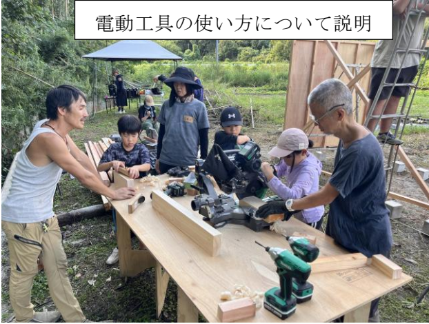
電動工具の使い方について説明