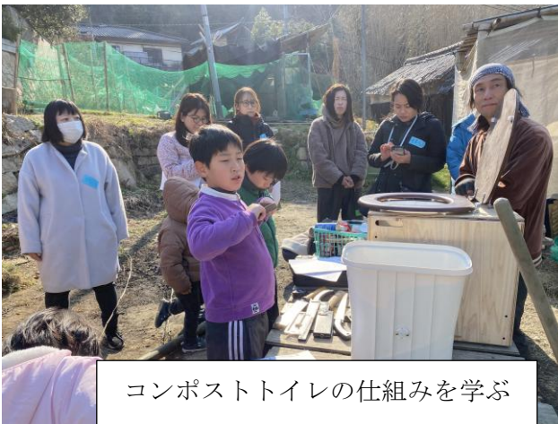
コンポストトイレの仕組みを学ぶ