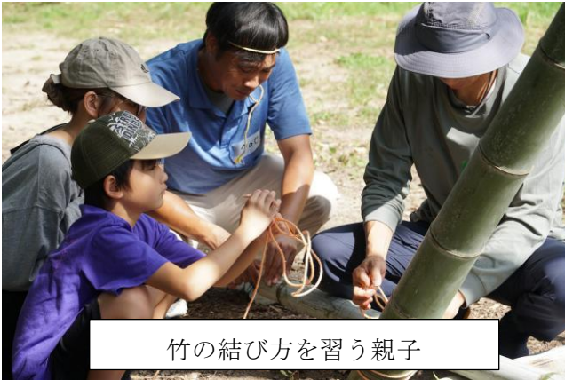
竹の結び方を習う親子