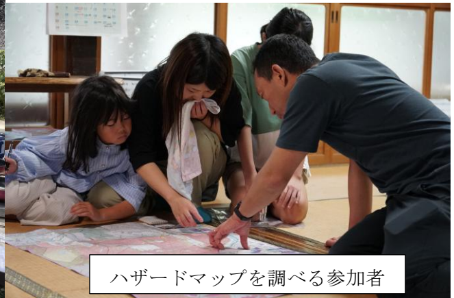
ハザードマップを調べる参加者