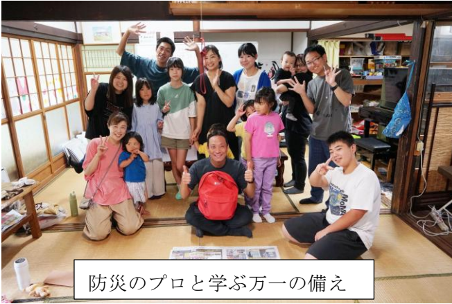
防災のプロと学ぶ万一の備え