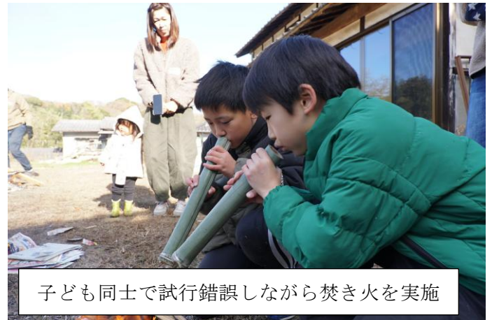
子ども同士で試行錯誤しながら焚き火を実施