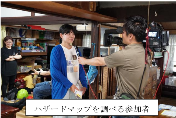
ハザードマップを調べる参加者